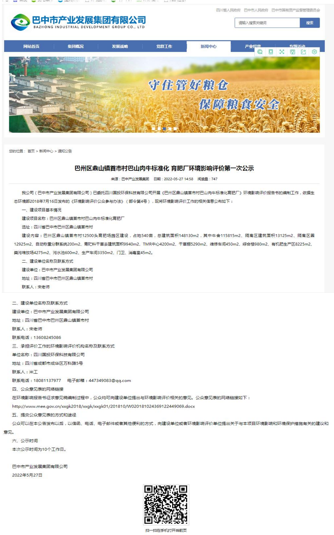
图 1-1 项目第一次公示图片