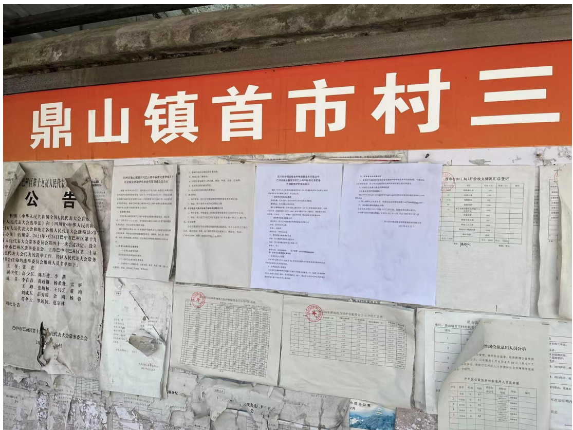
图 1-7 项目张贴公示