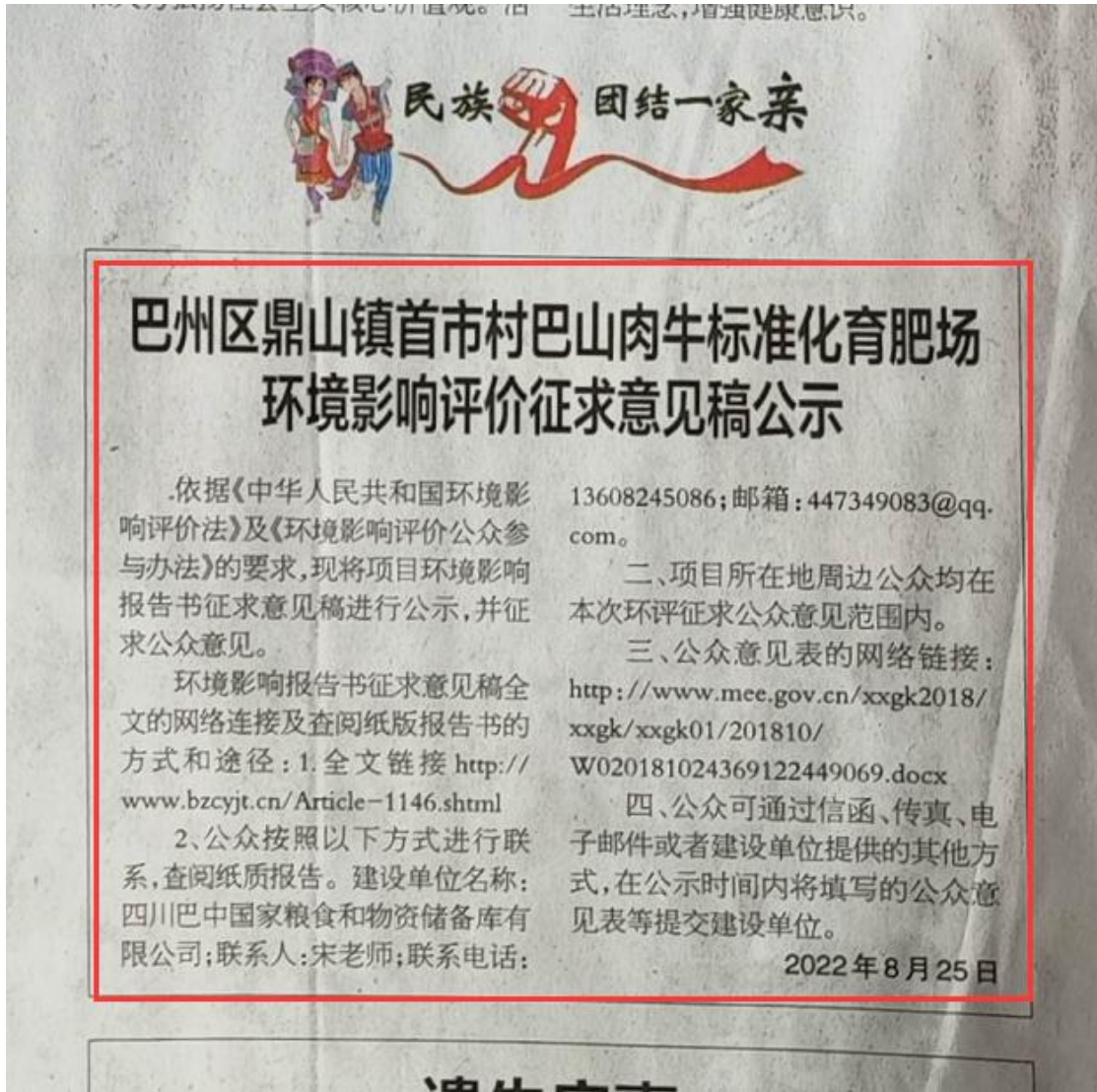
图 1-4 巴中日报 2022 年 8 月 25 日第一次刊登项目公示内容